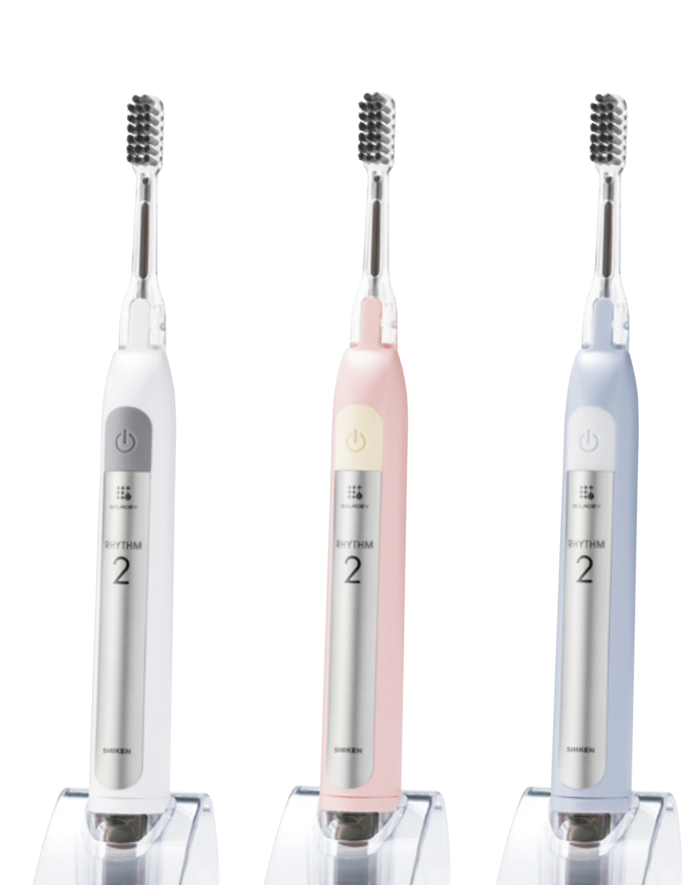
○ スノーホワイト ● ベビーピンク ● アイスブルー

世界12の国と地域で特許取得 日本(特許第3795515号)・アメリカ・カナダ・中国・イギリス・ドイツ・フランス・オランダ・スイス・スウェーデン・韓国・台湾